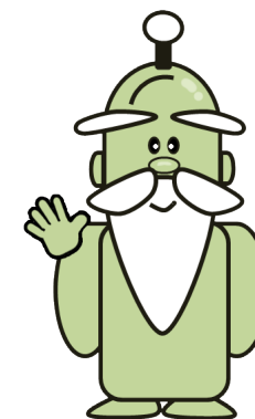
調べもの仙人 しるべえ